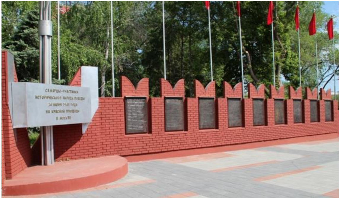
Стела и памятная стена «Земляки-самарцы – участники исторического Парада Победы в Москве 24 июня 1945 года»